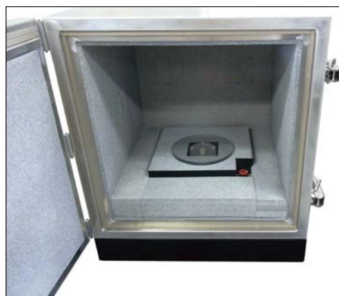
特注電波暗箱へ設置