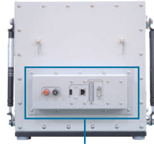
I/Fモジュールを取り付けたMY2510