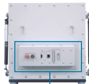
I/Fモジュールを取り付けたMY2510