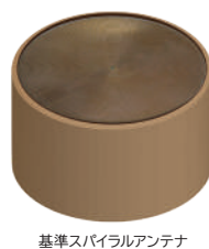
標準スパイラルアンテナ