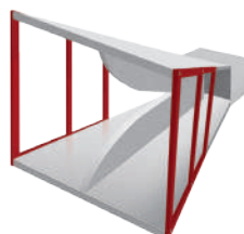
標準ホーンアンテナ